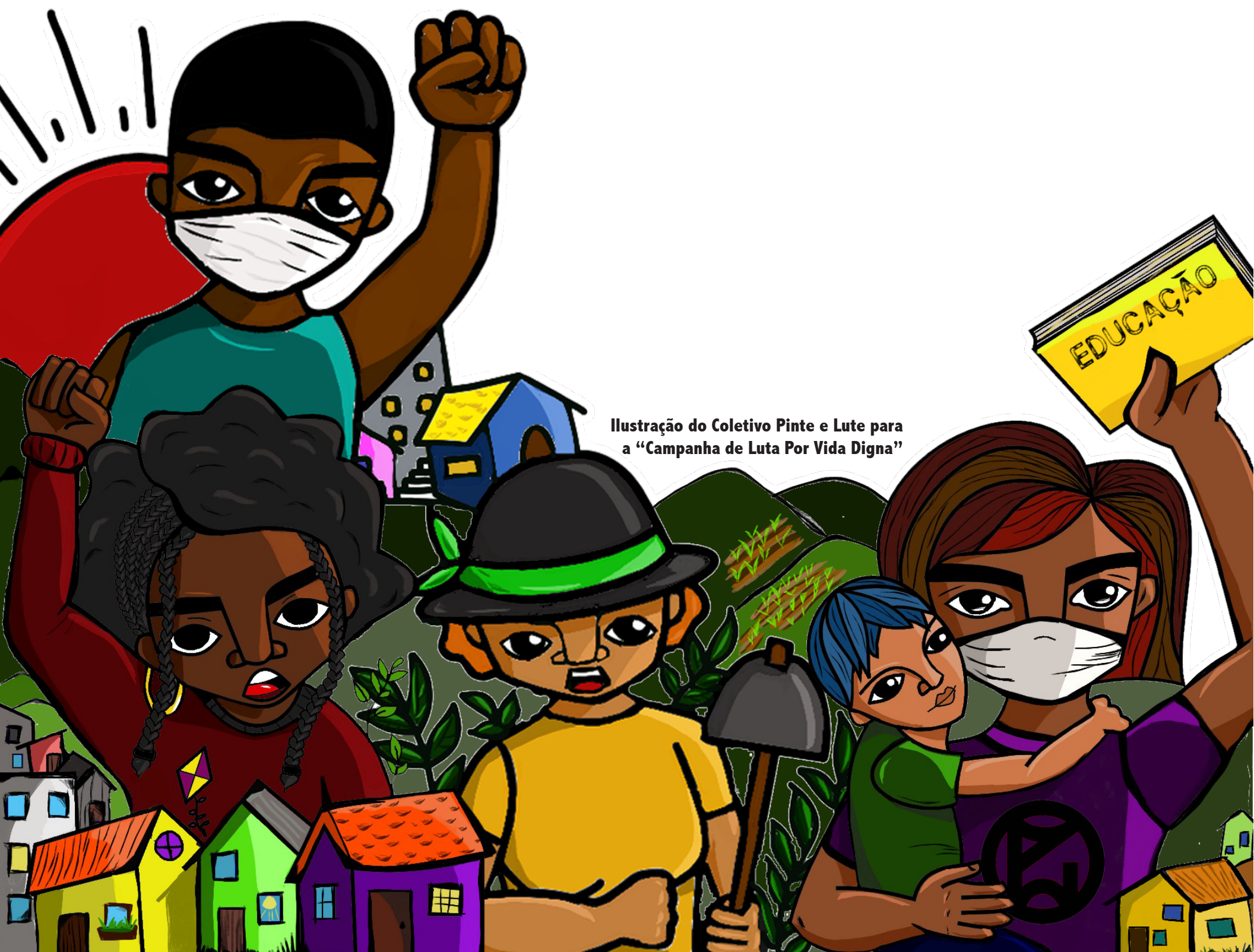
Ilustração do Coletivo Pinte e Lute para a "Campanha de Luta Por Vida Digna"

Expressões de resistência já estão acontecendo. Na Europa, houve painéis durante a quarentena e greves em setores em que se tentava impor a continuidade do trabalho às custas da saúde das trabalhadoras e dos trabalhadores, incluindo fábricas de grande porte e com sindicatos poderosos. Na Argentina, quem trabalha no setor comercial já se manifestou, exigindo o fechamento dos shoppings, assim como em outros âmbitos trabalhistas se discutem medidas de proteção da saúde. No Uruguai, o sindicato da construção conseguiu um acordo de licença especial, que em um primeiro momento o ministério da economia tinha feito fracassar. Do mesmo modo, o governo uruguaio defende um aumento de tarifas e dos impostos a partir de 1º de abril e as medidas para os setores que não têm previdência social são inexistentes no momento. Se realizam painéis e uma infinidade de sopões populares nos bairros e por iniciativa de sindicatos também.